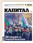
Капитал Брой 46 // 17.11.2018

Прочетете целия вестник или списание без да търсите отделните статии в сайта.