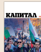
Емисия СЕДМИЧНИКЪТ //