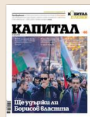
Капитал Брой 46 // 17.11.2018

Прочетете целия вестник или списание без да търсите отделните статии в сайта.