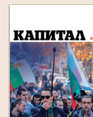
Емисия СЕДМИЧНИКЪТ //